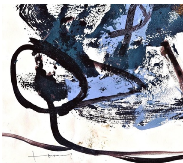
Peinture C. Voisard.